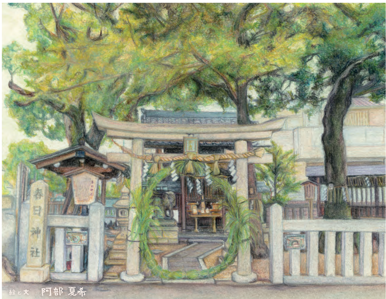
絵と文 阿部 夏希