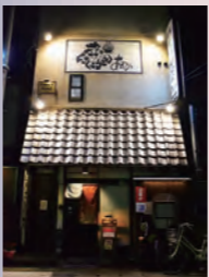
▲昼はうどん屋さん、夜に なるとライブハウスに！