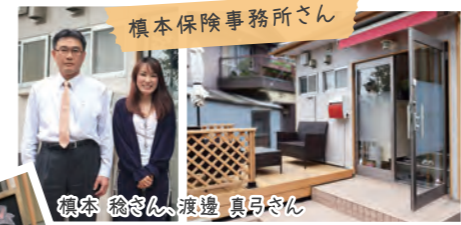
榎本保険事務所さん