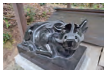
千丈天満宮で見つけた駒牛。 とても見晴らしの良い神社でした!

西京のステキ、不思議、不気味…ずっと気になっている謎のスポット、ヒト、物体を調べてほしいなど など編集部におまかせください! 西京区の食材で作った料理「西京めし」を紹介して下さる方も絶 賛募集中です。ご応募・お問い合わせの際は、お名前、ご住所、ご連絡先のメールアドレス、電話番 号を明記ください。 ※採用・不採用ともに情報資料、写真などの返却はできません。