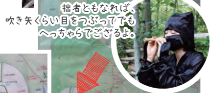
拙者ともなれば、吹き矢くらい目をつぶってでもへっちゃらでござるよ。