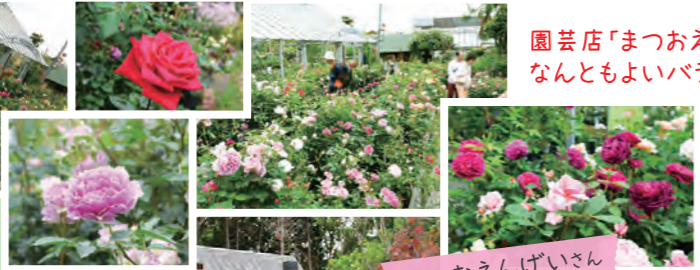
まつおえんげいさん

バラ約700品種を扱っており、実店舗園芸専門店では日本最大級の規模だとか。実物をその場で見て買えるので、名古屋や岡山など遠方から来られる方も多いうのだそう。