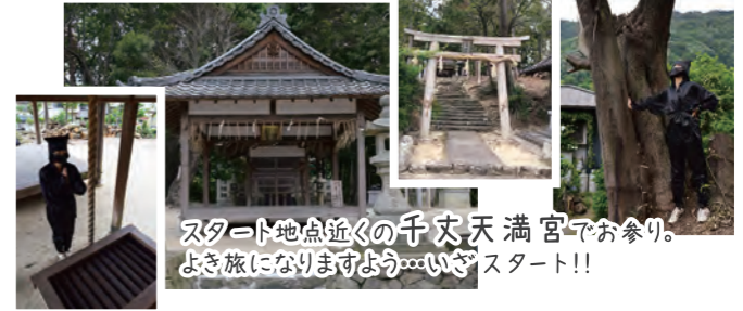
スタート地点近くの千丈天満宮でお参り。よき旅になりますよう…いざスタート!!