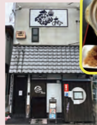
[日~木]11:00~20:00 [金・土]11:00~16:00 20:00~ライブハウス 年中無休