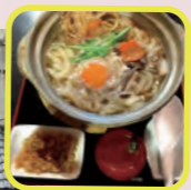
しこしこうどん あわの 西京区桂千代原町 61-3

その普遍性 と「音楽を聴 くだけでなく、 みなさんで楽 しめる参加型 にしたい」と いうご主人の