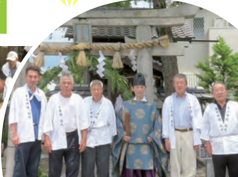
▲ 茅を巻き付ける仕上げの作業

総代だけでなく、北摂自治会の方々にも掃除の分担に協力してもらうことで、境内はいつも誰かの手が届いている。「地域の皆さんの手で守っている。ご近所さんの協力がないとできない」と総代たちは話す。「ここは本当に気持ちが良いと、取材中にも何人もお参りに来られていた。