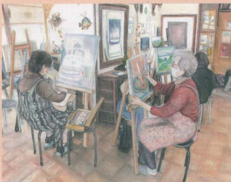
一般絵画教室風景