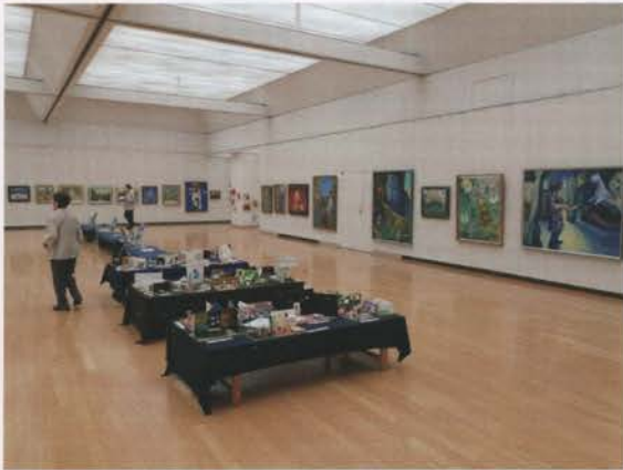
京都市美術館別館での作品展（毎年開催）